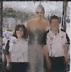
En haut : au milieu des enfants de l'école de La Turbie, sur les hauteurs de Monaco. Ci-dessus : dans son rôle d'ambassadrice des Special Olympics, le 24 septembre. Ci-contre : le 11 octobre, lors d'une soirée en l'honneur de Monaco Collectif Humanitaire, qui vient en aide à des enfants issus de pays en voie de développement.