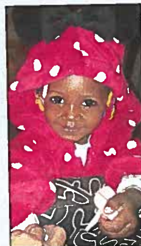
Un si joli sourire.

Malgré une inquiétude certaine des parents, ils savent que, dans leur malheur, leurs petits sont chanceux. Car chaque année, une vingtaine, voire une quarantaine d'enfants, tout au plus, peuvent se faire opérer, alors qu'ils sont plus de deux mille sur liste d'attente.