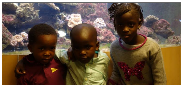
Autour de nos petits protégés, une vraie solidarité du cœur qu'ils savent bien reproduire