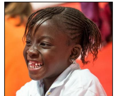
Une Clémentine sans pépin

L'intervention de la petite fille a été un succès, et son séjour de véritables vacances. C'est donc en pleine forme qu'elle a rejoint sa famille à Dakar, début décembre.