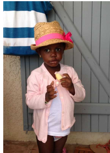
2 ans et demi du Burkina Faso

Ils sont arrivés ensemble du Burkina Faso pour rencontrer leurs familles d'accueil pour qui c'était, pour chacune d'elle, une première aventure.