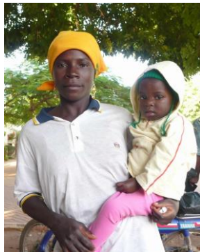
Windinzandé - Burkina