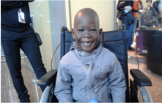
Avril 2018 - Sénégal Arrivée de trois garçons