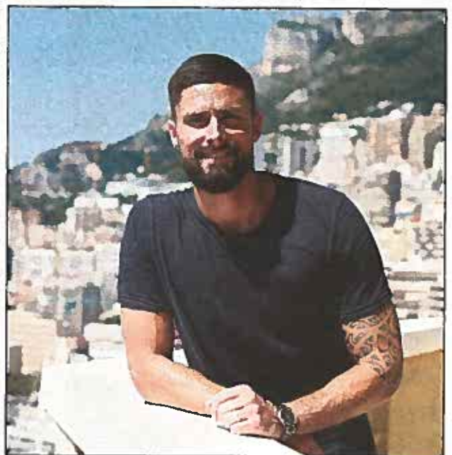
En vacances, le footballeur a fait escale à Monaco.

On aurait souhaité la même issue que pour nous l'été dernier, c'est sûr. Mais elles sont tombées contre les favorites, les États-Unis étaient au dessus. C'est dommage. C'était un match un peu frustrant pour elles j'imagine. Il va falloir continuer à apprendre et à progresser. Mais j'ai été séduit par leur qualité de jeu pendant cette Coupe du monde et j'espère que la prochaine fois, elles pourront la gagner et la ramener à la maison.