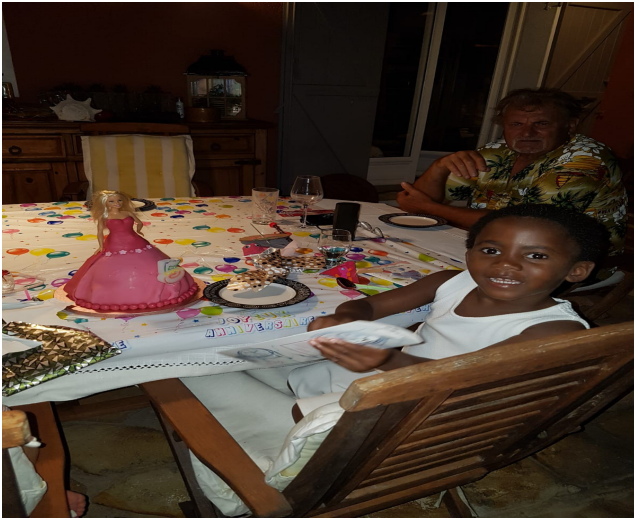
Beniella a fêté ses 5 ans

Encore un grand merci à nos deux familles d'accueil qui on su prendre en charge pendant de longs mois ces deux adorables fillettes.