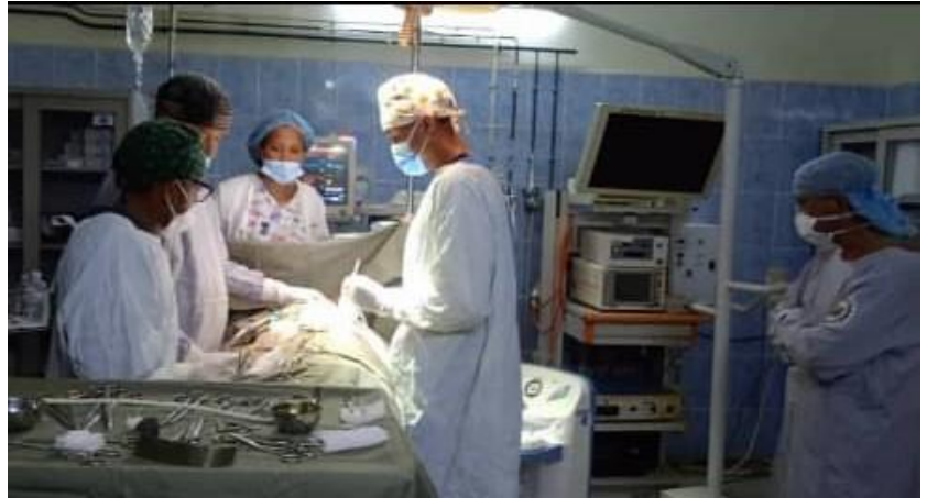
Opération d'un enfant à cœur fermé par l'équipe médico-chirurgicale du CENHOSOA

La veille de l'opération, l'enfant bénéficie d'un contrôle via une échographie cardiaque effectué par le cardiopédiatre du CENHOSOA afin de vérifier l'évolution de la cardiopathie de l'enfant. Cela permet également de prévenir l'équipe chirurgicale d'une éventuelle difficulté concernant la prise en charge pendant l'opération ou sur la prise en charge post opératoire immédiate.