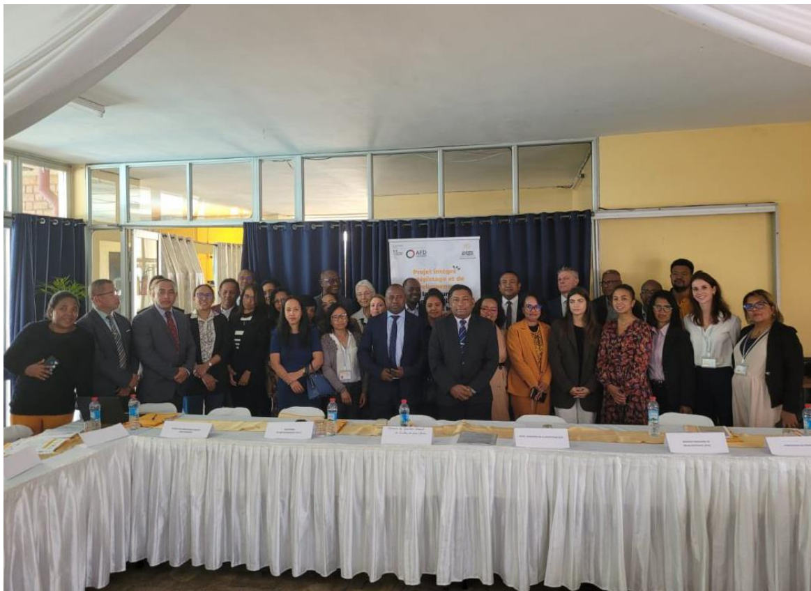
Réunion de lancement du Projet Intégré de Dépistage et de Développement de la Chirurgie Cardiaque Pédiatrique dans l'Océan Indien. Le 17 septembre 2024. Antananarivo.