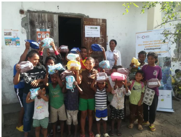
Distribution de kits d'hygiène bucco-dentaire à des enfants de la région Atsinanana. 22 août 2024. Ambodisaina. District de Toamasina 2.