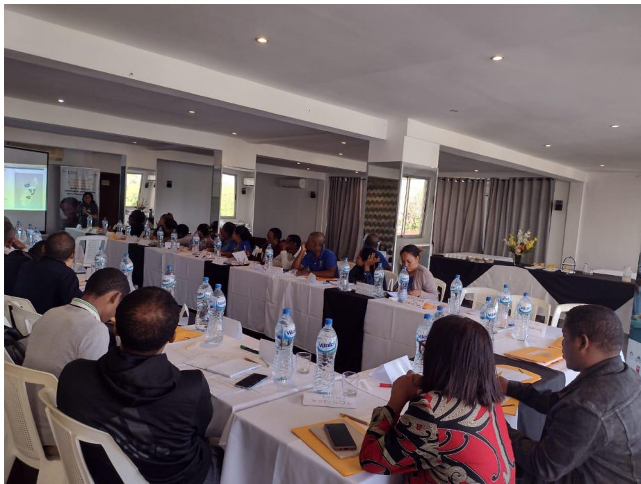
Formation théorique aux cardiopathies, à destination des personnels de santé de la région Atsinanana. 21 août 2024. Tamatave.