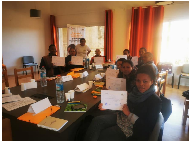
Gauche : Rencontre de l'équipe CDE avec le responsable régional de SOS Villages d'Enfants Mangarano. 19 juillet 2024. Tamatave.